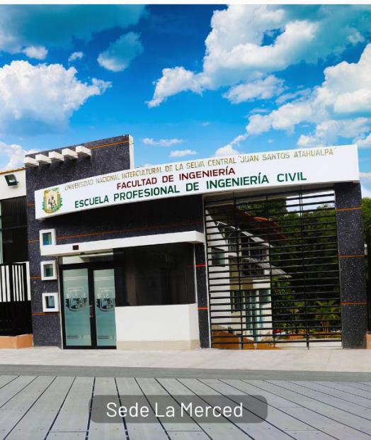
Sede La Merced

La UNISCJSA, cuenta con infraestructura, laboratorios y talleres debidamente equipados de acuerdo a los estándares de calidad para las cuatro escuelas profesionales en las sedes de La Merced, Pichanaqui y la filial Satipo, cuenta con una plana de docentes debidamente acreditados y calificados para ejercer la docencia universitaria y para garantizar la formación académica e investigativa de calidad. Asimismo, cuenta con servicios complementarios que garantizan la formación integral de la juventud estudiosa. Nuestro compromiso es lograr que nuestros estudiantes obtengan una formación profesional de calidad, acorde a las necesidades del mercado laboral respetando las prácticas interculturales de los pueblos originarios del Perú.