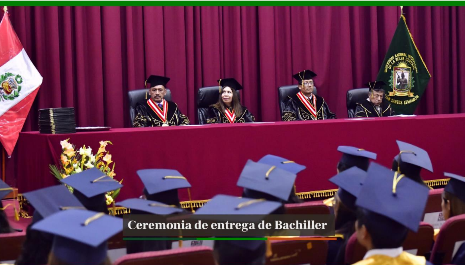
Ceremonia de entrega de Bachiller

La Universidad Nacional Intercultural de la Selva Central Juan Santos Atahualpa es referente nacional e internacional de la universidad intercultural y líder en la producción de conocimientos y prácticas interculturales que los pueblos de la selva central aplican para su desarrollo.